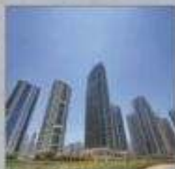
Jumeirah Lake Towers