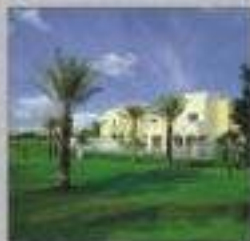
Meadows & Springs