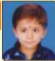
ધરણ્ય પ્રવાલ જ્ઞાનીભાઈ રાજકોટ, ૬૦૬