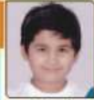
જનકા મોહનીય પ્રદીપલાઈ મીઠા, ૬૦૧૩