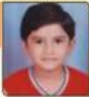
ઘણાણ વૃષ્ટિ ધ્રાવણભાઈ જામનોલુકા, ૬૫, ૫૦૩૬