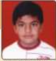
ઘણાણ મિતુજ સુખેશભાઈ સાસી, ૬૦૩૬