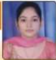
અણ્ણકા અર્ધા અવકાશભાઈ અવકાશભાઈ, ૨૫૩