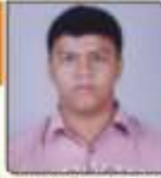
મહાદા જયદેવ સર્વજીભાઈ ભવનરા, ૧૧, ૮૭૬