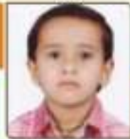
પદ્મા સિદ્ધિશ દલિભાઈ જાન્યુ. ૧૧. ૯૦૩