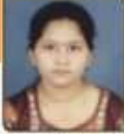
સલિફુવર મેઝીયા કુસમુભાઈ મુલ્યાં, ૨૫૩