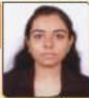
મહાદા શ્વેતા કાલિભાઈ ભવનરા, ૭૭, ૮૭૬