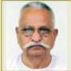
શ્રી મહાલાલ મહાલાલ મહાલાલ વાયા