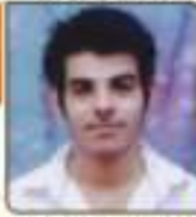
મહાદા ઉમંગ જેન્નીભાઈ ભવનરા, ૭૭, ૭૭૬