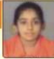
પાલ્લા જાનવી અનિલભાઈ જાલ દેવગાંધી, જી. ૧૨૦