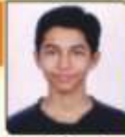
પદ્મણી વિરલ જે. ગુરુ, ૨૫૦૩