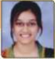
સાકર મોડીયા અનીભાઈ અવકાશભાઈ, ૩૪૨, ૩૦૦