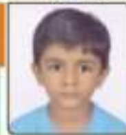
જગદા દેવ ૧૧. ૫૦૩