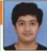
રાહોડ યશ કેશવભાઈ ગુજરાત, ૨૪૩