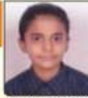
ધાવડા જાનવી શિહારીભાઈ સાથેલ, ૬૮૬