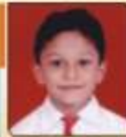
સીમી ઠીસા બેસા, ભવનગી, ૬૦, ૬૦૩૬