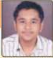
પદ્મણી વ્યવલ સિદ્ધીખુરા સાંચી, ૨૩.૧૨૦૩