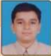
પદ્મણી સંવેદ સ્વપ્નભાઈ સાથેલ, ૬૯૬૭૨