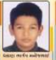
પદ્મા ભાગ્ય શ્વેતભાઈ ૧૧. ૫૦૩