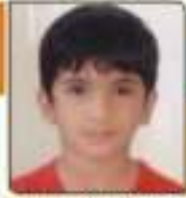
કાનકલા સુવલ ઠિરેખલાઈ રાજકોટ, ૬૦૧૩૩૩