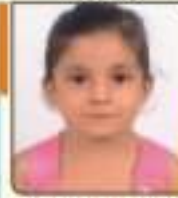
સતિષ્કર પુત્રી દીપકભાઈ વેરાવળ, ૦૨૧૩