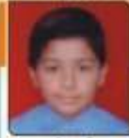
પાલ્લવ ખરુન અમિતલાઈ પાલ રેવોલિય, ૬૦૧૩