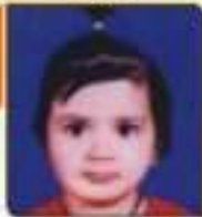
ચીટા સારી કે. જાન્યુ. ૧૧. ૯૦૩