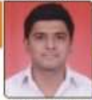
અણ્ણકા રિલ પ્રકાશભાઈ અવકાશભાઈ, ૩૪૨, ૨૦૦