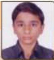
મહા મિલિપ દેવભાઈ વડોદરા કોલેજ, ૭૭, ૮૭૬