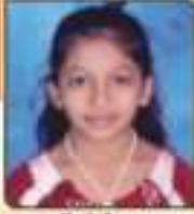
સુરુ શિવી દિપ્તીભાઈ સપ્ટેમ્બર, ૨૦૧૩