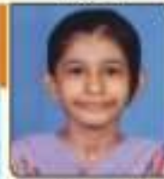
સહા દેશા નિરંજનભાઈ મુમુમ, ૬૦, ૫૦૩૫