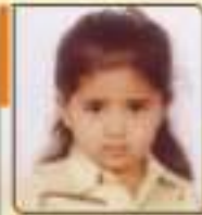
કાનકા પુત્ર મોખલાઈ ભુલ, ૬૧૨૩૦૩