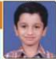
ધોરણ જય પેટલુભાર રાજકોટ, ૬૧૨૩૩૩