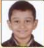
ધરણ્ય રેલ સંજયભાઈ રાજકોટ, ૬૫૫