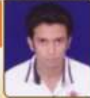
મહાપાલ દુષ્ય રવિદાસભાઈ કોપામેટી, ૭૭, ૭૭૨