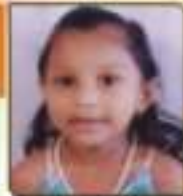
પદ્મા પ્રતિ દિવેશભાઈ જાન્યુ. ૧૧. ૯૯૩