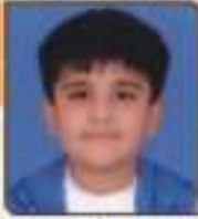
ધરણ્ય ઠપ્પે ભરતભાઈ રાજકોટ, ૬૫૫