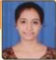
અંશુવર વિલ મહાદેવભાઈ મણવેલ, ૨૦૦-૨૨૩