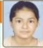
ધાવડા અંજલી પ્રફુલભાઈ સાથેલ, ૬૯૬૭૨