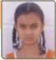
ધવલા પ્રતિભા સિદ્ધિજીભાઈ મહાસાગર, ૨૬.૧૧૧૩