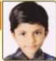
વાલા મેલાલી અનિલભાઈ સુભા. ૦૪.૦૧૪