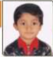
પદ્માલ દરશિત કલ્પેશભાઈ સુભા. ૦૪.૦૧૪