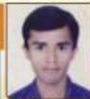
મોક્ષી જીનર વિજયભાઈ કાઠી, ૫૩,૩૩૪