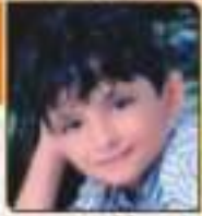
કમલકા રાજ બોનેરાલાઈ રાજકોટ, ૬૦૧૩