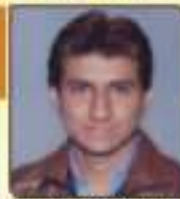
પટ્ટણી ભાવિન વિજયભાઈ મીઠાપુર, ૩૦૪