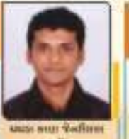
પદ્મા સુધા જેનીશભાઈ જાન્યુ. ૧૧