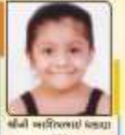
સીની અનિભાઈ પદ્મા ૧૧

આપ સર્વે હૃવલમાં ઉત્તરોત્તર પ્રગતિ પામો તેમજ સમાજના ઘડતરમાં