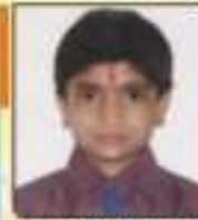
ધાવડા સમીર કિશોરભાઈ ભવી હાંશિકા, ૬૯૬