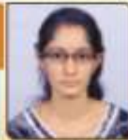
સિદ્ધહર કુવેલા અંકડાભાઈ અવકાશભાઈ, ૩૪૨, ૨૦૦