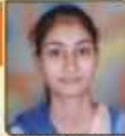
મહાપાલ ન્યાલ બીપીનભાઈ આપરુકોલા, ૭૭૨, ૭૭૩