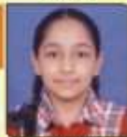
જખીયા નિર્મી મહેશભાઈ રાજકોટ, ૨૫.૪૩૩