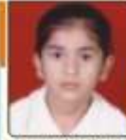
ધાવડા ઉર્વશી શિલ્પભાઈ સાથેલ, ૬૯૬૭૨