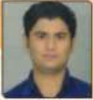
સુર વિરમ મેહા, કુટુંબ વિભાગીય, ૩૦૦