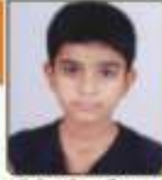
ધોરણ્ય મુવીન પ્રવિણભાઈ રાજકોટ, ૬૦૫