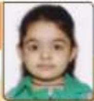
ધોરણા વિજય દિવેશભાઈ સુભા. ૦૪.૦૧૪