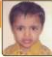
સાલક કિશ વાવ. રાજકોટ, ૨૪.૦૨૧૩