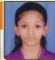
સતિષ્ઠુવર મુખી ભવનભાઈ મુમુમ, ૬૦૩૬