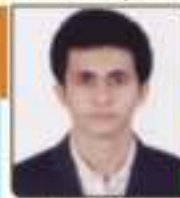
ધણ્ણા નિખીલ જામનગર, ૪૪૪