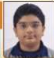
પઘડણી દેવિશ બિંદીતભાઈ રાજકોટ, ૨૪.૧૫૩