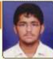
વિકાસ દર્શિત શહેરમજાઈ સાંચી, ૨૭.૧૧૦૩