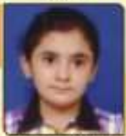
ધવલા મુશ્કામ વિજયભાઈ મોડા, ૨૬.૧૧૨૩