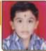
ધરણ્ય ઝિરેશ વિદ્યાભાઈ રાજકોટ, ૬૦૬