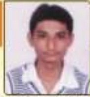
અણ્ણકા અર્ધા અવકાશભાઈ અવકાશભાઈ, ૩૪૨, ૩૦૦