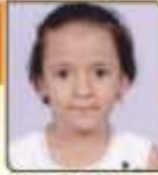
ધોરણ મિત્રી કિરિભાઈ રાજકોટ, ૬૩૪૫૨૬