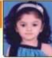
સાગર દિવા ઘરિયાભાઈ દીડીયા, ૧૦૦૨૦