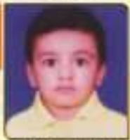
મોહની રીશ નિરેખલાઈ રાજકોટ, ૬૦૧૩