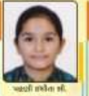
પદ્મા સ્મૃતી બી. ૧૧. ૫૦૩