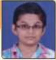
ધવલા વિદ્યા રાજીવજીભાઈ જામનગર, ૨૬.૧૧૧૩