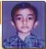
પાલ્લવ રેખા અમિતલાઈ કેમળીયા, ૬૦૧૩