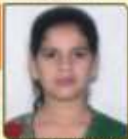
જાગડા બંજરી કિરિતભાઈ રાજકોટ, ૨૫.૨૮૩