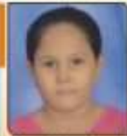
વહેજર રીષીકા રમેશલાઈ રાજકોટ, ૬૦૧૩૦૩