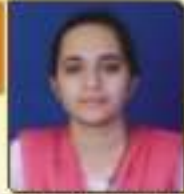
જવડા હાલિકા જનકિશનભાઈ ભીરુ વડવા, ૬૪,૭૫૪