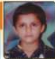
સાગર મલય કમલેશલાઈ કોટકા, ૬૦૧૩