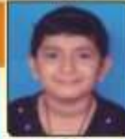
મહાદેવ કાદે ધોરણભાઈ સપ્ટેમ્બર, ૨૦૧૩