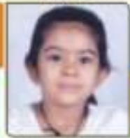
પદ્માલ મંજી અર. રાજકોટ, ૬૦૧૩