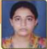
ધાવડા અનસી વીરજભાઈ ભીરુ વડવા, ૬૪,૭૫૪