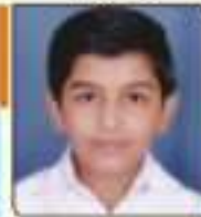
ઘઘડા વેદન સુનેશભાઈ વિજાપુર, ૨૦.૧૫૩