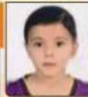
સતિષ્કર દર્શન જયદેશભાઈ ભુજ, ૦૨૦૨