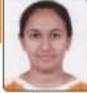
સહ્યા મેઘા રમેશભાઈ સાચકોટ, ૨૪૨,૨૪૩