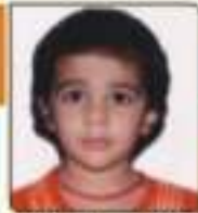
પદ્મા કંગલા અનુપભાઈ જાન્યુ. ૧૧. ૯૪૩