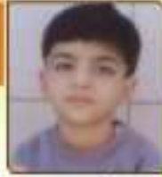
ઘણા જય કુતોન્બભાઈ ચામનગા, ૬૦૩૬