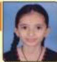
ઘોરણ મિના કુતોન્બભાઈ સામણ, ૬૦, ૫૦૩૬