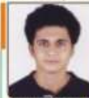
ધણ્ણા વચા નિલેશુભાઈ જામનગર, ૪૪૪