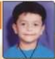
સાગર પિત નિરેખલાઈ કોટકા, ૬૦૧૩