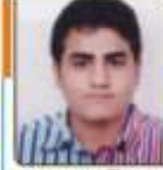
ધાવડા ભજવ દિલ્લાભાઈ લુણા, ૨૦૪