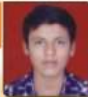
સાગર પુષ્પ દુરમુખભાઈ કોલેજ-કુલમુખ, ૩૪, ૭૭૬