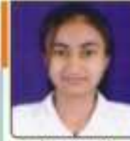
સિદ્ધહર અર્ધા પી, વેંગુડ, ૨૦૨, ૨૫૦