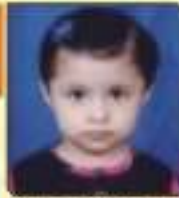
ધરણ્ય જામવી કેતનભાઈ રાજકોટ, ૬૦૬