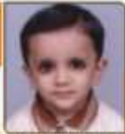
ચીટા મોહિત શેરભાઈ જાન્યુ. ૧૧. ૯૪૩