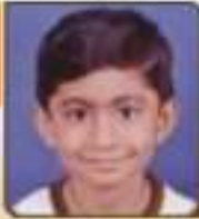
સુરુ કલ્યાણ અનુભાઈ સપ્ટેમ્બર, ૨૦૧૩