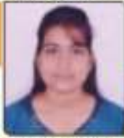
સાગર વિકા અરેભાઈ ભવનરા, ૩૭૬