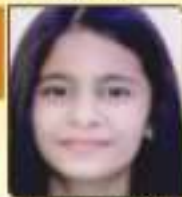
ઘઘડા કલિયા મેન. જામનગર, ૨૫.૧૧૩