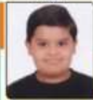
કાનકા વિલી નિરેખલાઈ મીઠા, ૬૦૧૩૩૩