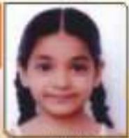
જનકા નીતી નિરેખલાઈ રાજકોટ, ૬૦૧૩