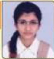
હુદાર નાહતા સુરેશભાઈ ભવનરા, ૬૮, ૭૭૬