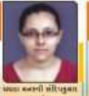
પદ્મા સ્મૃતી સીત્લુભાઈ જાન્યુ. ૧૧