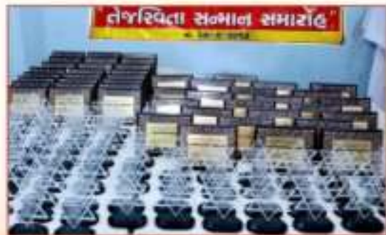
તેજસ્વી વિદ્યાર્થી સન્માન સમારંભ-૨૦૧૩ના તેજસ્વી વિદ્યાર્થીઓને અપાવેલ એવોર્ડ સ્પ્ટીમાન ધાઈ છે