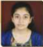
પદ્મ કાવ્ય મહાભાઈ વેરાવળ, ૨૨, ૭૭૬