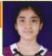
યાદા અનસી વેદાભાઈ મહેસાણા, ૨૫.૭૫૩