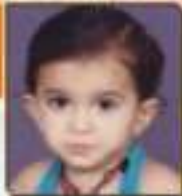
પદ્મા અંબી આર. સુભા. ૮૪૩