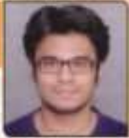
સોની ધર્મિક રાજકુમાર ભણવેલ, ૨૧૪