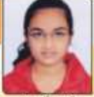
ધાવડા કલિયા ડી. ભવડીયા, ૬૨,૬૨૪