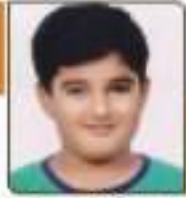
ધાનક પાર્શ્વ અનિખલાઈ ભુલ, ૬૧૨૮૩૩