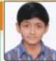
હાલદ નિલય મનોજભાઈ રાજકોટ, ૨૪.૫૧૩