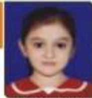
કેટેજર શ્રેક વિમલભાઈ જાન્યુ. ૧૧. ૯૪૩