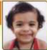
પદ્મા કલ્યા જયેશભાઈ જાન્યુ. ૧૧. ૯૪૩