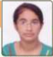
ધોરણ વિદ્યા અરોહભાઈ રાજકોટ, ૨૬.૧૧૧૩