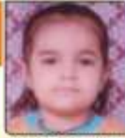
જગદા દિસાંરી પ્રકુભાઈ ભુજ, ૦૨.૦૨૦૨