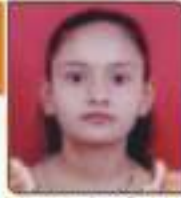
વિકાસ ખાલી અધિકાલાલ સાંચી, ૨૬.૨૨૦૩