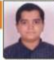
ધાવડા જેનીસ શ્વેતાભાઈ સાથેલ, ૬૯૬૭૨