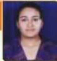
ધોરણ બંજરી જનકિશનભાઈ જામનગર, ૨૭.૧૧૩