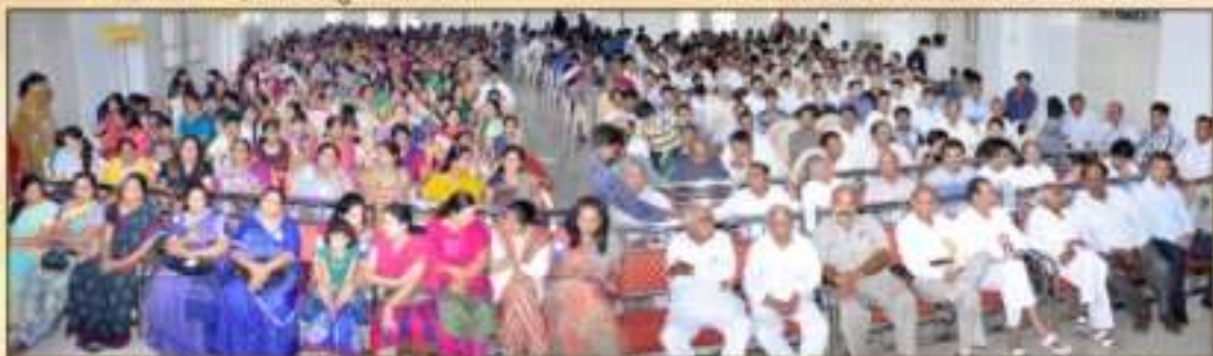
તેજસ્વી વિદ્યાર્થી સન્માન સમારંભ-૨૦૧૩માં ઉપસ્થિત રહેલા અમંત્રીત મહેમાનો, અતિથિ વિશેષક્રીઓ તથા વિદ્યાર્થી ભાઈ-બહેનો