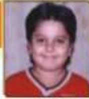
ધરણ્ય રિપ્પે પ્રદેભાઈ રાજકોટ, ૬૦૬