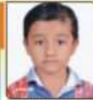
કલ્પિત મનુષ્ય ડી. સુભા. ૦૪.૦૧૪