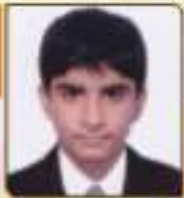
શાનકા પાર્વિ સંજયભાઈ રાજકોટ, ૨૬.૧૧૨૩