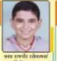
સા રામવેર સેલભાઈ જાન્યુ. ૧૧