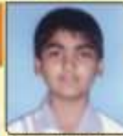
ધાવડા આરિય શ્વેતાભાઈ ભવી હાંશિકા, ૬૯૬