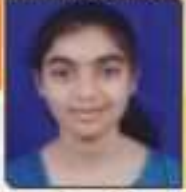
ધાવડા કીમલ બીપીભલાઈ ભવડીયા, ૬૪૪ / ૬૨,૬૨૪