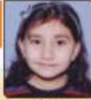
ધરણ્ય ઝિર વિજયભાઈ રાજકોટ, ૬૦૬