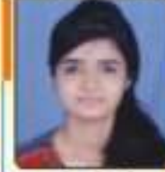
ભાગ્ય સોનલી લલીતાભાઈ કોટીયા, ૬૪૪