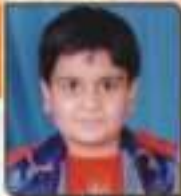
ઘઘડા પાર્વ જનકિશનભાઈ રાજકોટ, ૨૭.૫૪૩