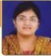
પ્રાનલ પ્રિયતી ભલ્લભાઈ ગુજરાતી, ૨૧૧૩