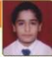
સતિષ્ઠુવર કેવલ ઘણેશભાઈ મુમુમ, ૬૦૩૬