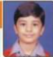
પદ્મ ભાગ્ય સુનિભાઈ જાન્યુ. ૧૧. ૯૪૩