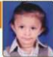
હાહા ડીર બી. ૧૧. ૫૦૩