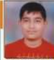
સતિયુગ્મ અંકિત શુભીભાઈ ઉભા, ૬૯૬૭૨