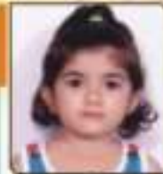
સાગર શ્રેક એચ. જાન્યુ. ૧૧. ૯૯૩