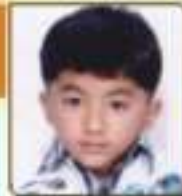
સાગર મીત એચ. જાન્યુ. ૧૧. ૯૪૩