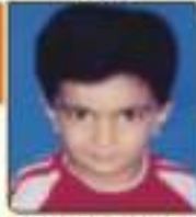
ધોરણ્ય આર્યન વિરલભાઈ રાજકોટ, ૬૧૨૪૩૬