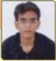
અણ્ણકા અર્ધા અવકાશભાઈ અવકાશભાઈ, ૩૪૨, ૩૦૦