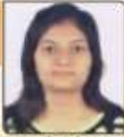
સાગર શાંતી દિનેશભાઈ ભવનરા, ૧૮, ૭૭૬