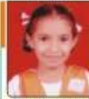
સતિષ્ઠીવર શિખા અમિતભાઈ સપ્ટેમ્બર, ૨૦૧૩