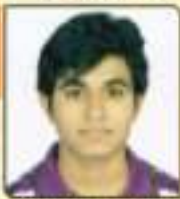
ધણ્ણા સન્ની અનુભાઈ વલસાડા, ૨૨૪