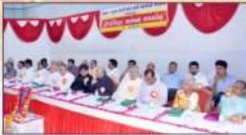
તેજસ્વી વિદ્યાર્થી સન્માન સમારંભ-૨૦૧૩માં ઉપસ્થિત અતિથી વિશેષક્રીઓ દંટીમાન થાય છે.