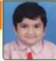
પદ્માલ દરશિત એલ. સુભા. ૦૪.૦૧૪