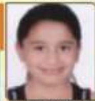
સાગર કાશી જયદેશલાઈ ભુલ, ૬૧૧૩