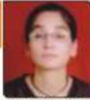
સતિયુગ પીલત સમભાઈ ભવનરા, ૨૩, ૭૭૬