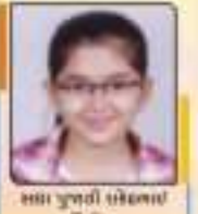
સા પુષ્પા સેલભાઈ જાન્યુ. ૧૧