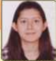
કોટવા મિતલ પ્રવિણાબેન સાચકોટ, ૨૪૨,૨૪૩