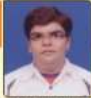
કેંજ તેજ ભટ્ટભાઈ કોપ, ૫૬૨,૫૬૩ / ૭૭૨,૭૭૩