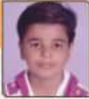
મહેશ્વર વાગ ધોરણભાઈ સપ્ટેમ્બર, ૨૦૧૩