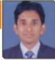
સિદ્ધહર પારલ અમુભાઈ અવકાશભાઈ, ૫૩૨, ૫૦૦