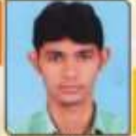
વાયા રવિ કિશોરભાઈ મહાપાલ, ૨૬૨, ૨૬૩