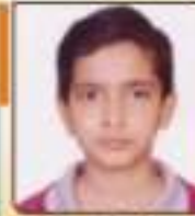
સતિષ્ઠીવર દર્શન ધોરણભાઈ સપ્ટેમ્બર, ૨૦૧૩