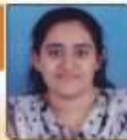
ધણ્ણા દિગ્વી અર. રાજકોટ, ૧૬,૨૦૪