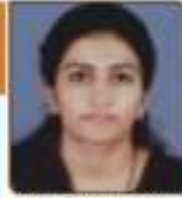
શુભામ રિપલ પ્રકાશભાઈ અમરભાઈ, ૨૩૨, ૫૦૦