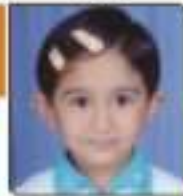
રસમ જીત પેલભાઈ જાન્યુ. ૧૧. ૯૪૩