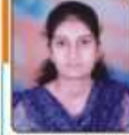
ધાવડા અંકિતા વિપીભાઈ ભવડીયા, ૭૫,૬૨૪