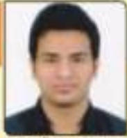
અણ્ણકા અર્ધા અવકાશભાઈ અવકાશભાઈ, ૩૪૨