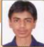
જખીયા મિયાંત દિલ્લભાઈ મોરકોટ (કોપ) ૭૭૧