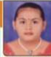
પદ્મ મીનારા અનુભાઈ સપ્ટેમ્બર, ૨૦૧૩