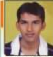
સિદ્ધહર અર્ધા અવકાશભાઈ અવકાશભાઈ, ૩૪૨