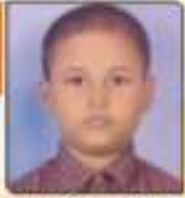
કાનકલા વિહાજ જયેરાલાઈ રાજકોટ, ૬૦૧૩૦૩