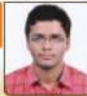
પ્રાનલ આરિહાસ વિપ્લવભાઈ ગુજરાતી, ૨૦, ૨૧૧૩