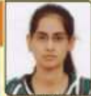
વાયા પુષ્પા જયંતભાઈ સાચકોટ, ૫૫૭,૨૬૨