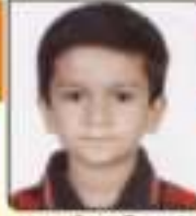
ધરણ્ય રેવ્ય મહેશભાઈ રાજકોટ, ૬૦૫